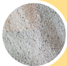
Hagelslagstructuur van Broei'Stop

Verpakking: 20 kg zakgoed, droog bewaren